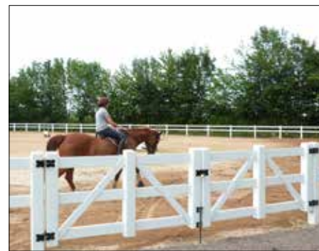
Dallas ridebane med 2-lektet gjerde og matchende dobbeltgrind

Kontakt ditt nærmeste Poda-senter, og få en uforpliktende prat om mulighetene.