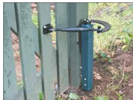
Hier ziet u de hekopener zelf, gemonteerd op de paal van het hek.

Voor de veiligheid wordt biologisch afbreekbare hydraulische olie gebruikt die goedgekeurd is voor gebruik in de buurt van waterlopen en bosgebieden.