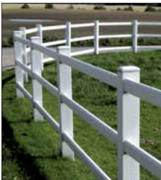
Derby omheining met 3 liggers Verschillende hoogtes mogelijk