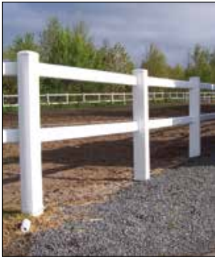
Derby omheining met 2 liggers Verschillende hoogtes mogelijk